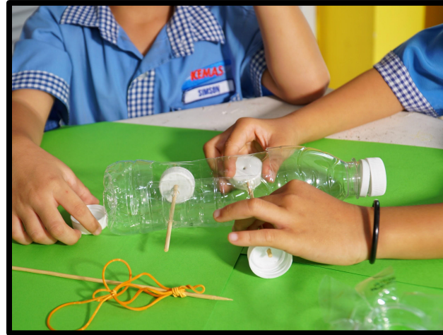
Kanak-kanak mencantum penutup botol untuk dijadikan tayar