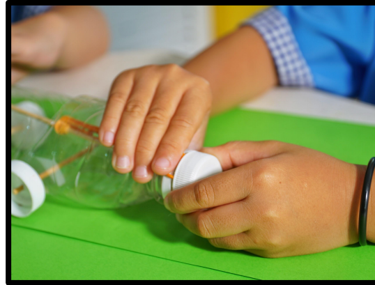
Kanak-kanak mengetatkan penutup botol setelah menarik keluar gelang getah