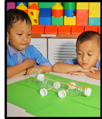
Kereta botol plastik yang telah siap