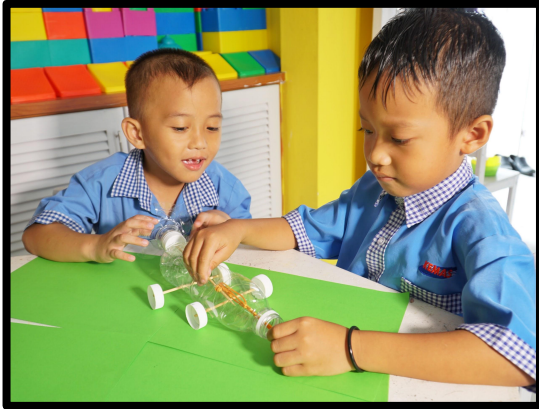
Gelang getah ditarik keluar mulut botol