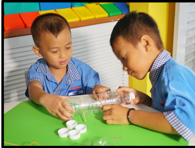
Batang lidi dimasukan ke dalam lubang botol plastik