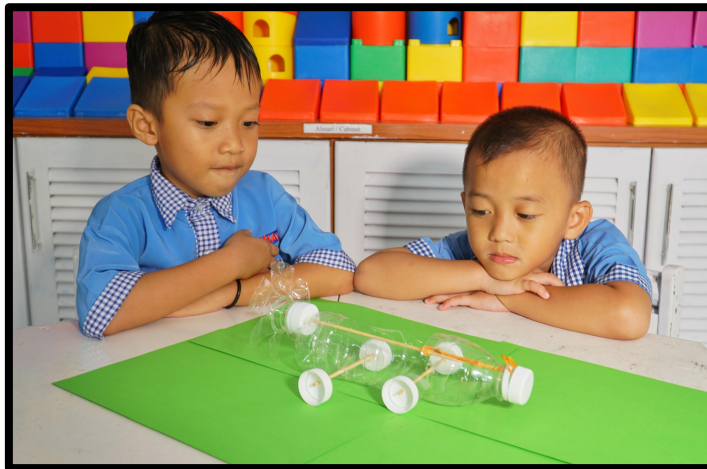
Kereta botol plastik yang telah siap